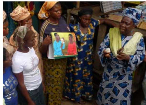
Démonstration de l'utilisation du préservatif féminin au Nigeria

Ce chapitre décrit les différents secteurs de la société avec lesquels vous pouvez faire équipe pour assurer un accès au préservatif féminin. Il y a le non commercial à but non lucratif qui fournit le préservatif féminin aux centres publics comme les cliniques, les centres de planification familiale, les centres de dépistage volontaire et de prise en charge en VIH/SIDA, et à certaines ONG/OCB. Puis il y a le secteur privé qui vend le préservatif féminin pour faire des bénéfices. Les ventes dans ce secteur sont souvent alimentées par des campagnes de changement de marque qui aident à attirer les consommateurs. En outre, le marketing social peut se révéler un moyen efficace de continuer à créer la demande en abordant une préoccupation de santé publique courante. Le marketing social renvoie à l'utilisation de techniques de marketing pour atteindre des objectifs comportementaux qui profitent au bien-être d'une société dans son ensemble. Dans ce sens, il peut profiter à la fois au secteur public et au secteur privé. Durant la programmation de la promotion du préservatif féminin à grande échelle, vous allez sûrement rencontrer ces différents secteurs et leurs approches subséquentes à la création de la demande et de l'accès.