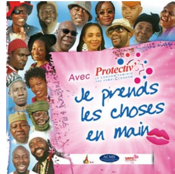
Poster de la Campagne Protectiv' : Préservatif féminin du programme de préservatifs féminins au Cameroun

Les informations ci-dessous se fondent sur le préservatif féminin FC2, le plus utilisé actuellement. Les autres types de préservatifs féminins revendiquent des messages et des stratégies de communication différents basés sur leurs caractéristiques uniques. Vous trouverez des informations plus détaillées, tant sur le FC2 que sur les autres préservatifs féminins dans la Foire Aux Questions (FAQ).