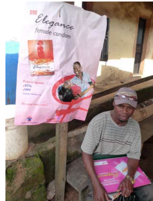
Poster pour la Campagne "Elegance", préservatif féminin du programme de préservatifs féminins au Nigéria

Les affiches, banderoles, dépliants, sites web et autres documents écrits et visuels vous offrent un moyen de communiquer avec votre public cible. Les messages doivent être les mêmes que ceux qui sont véhiculés à travers la communication interpersonnelle, la sensibilisation ou l'éducation ludique, mais ils doivent toujours être concis puisque les gens n'ont pas le temps de lire de longs textes. Les supports visuels devront être aussi captivants que possible en utilisant des couleurs attrayantes et des photos. Après la séance de promotion, les gens peuvent emporter un dépliant échantillonné pour le montrer à leur partenaire à la maison. Ils peuvent également consulter un site web pour plus d'informations. Le fait de pouvoir toucher le produit durant la promotion du préservatif féminin est essentiel afin de permettre aux gens de se sentir suffisamment à l'aise pour s'ouvrir au produit et à son utilisation