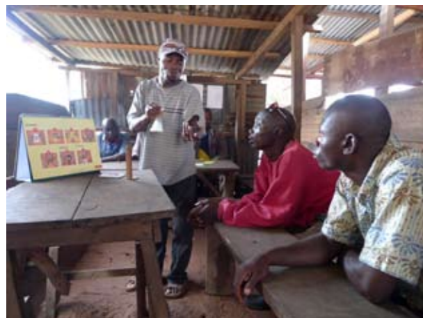
Un pair durant une séance d'éducation par les pairs : un chauffeur de taxi explique les bénéfices et la façon d'utiliser le préservatif féminin à ses collègues

file. Souvent, différents types de pairs éducateurs contribuent au programme de préservatifs féminins. L'organisation chef de file (régionale) ou les organisations à base communautaire concernées les soutiennent dans leurs activités quotidiennes d'appui à l'utilisation du préservatif féminin.