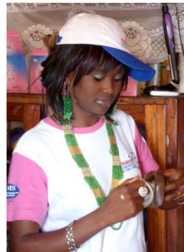
Aunty Queen Beauty Salon à Buéa au Cameroun : démonstration de l'utilisation du préservatif féminin