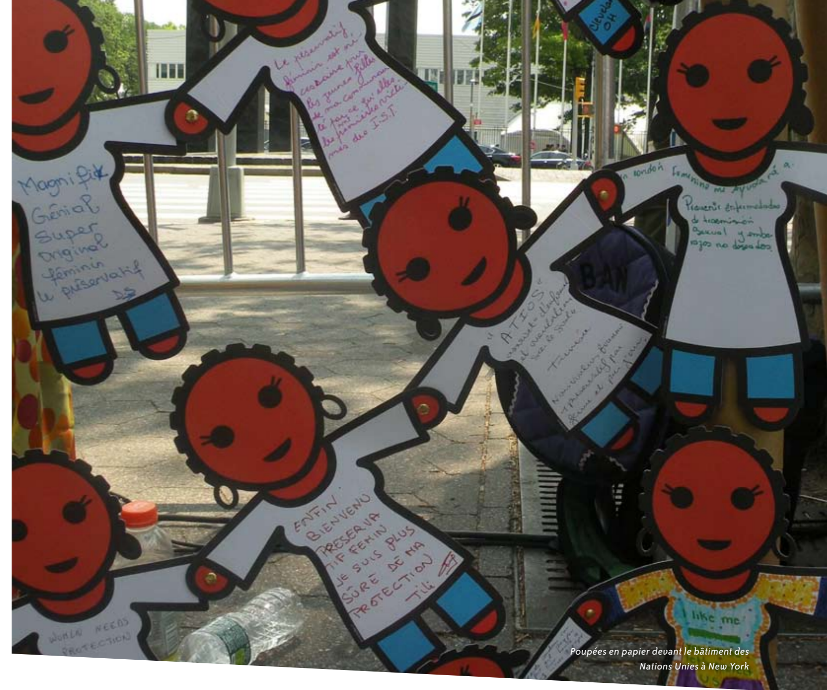
Poupées en papier devant le bâtiment des Nations Unies à New York