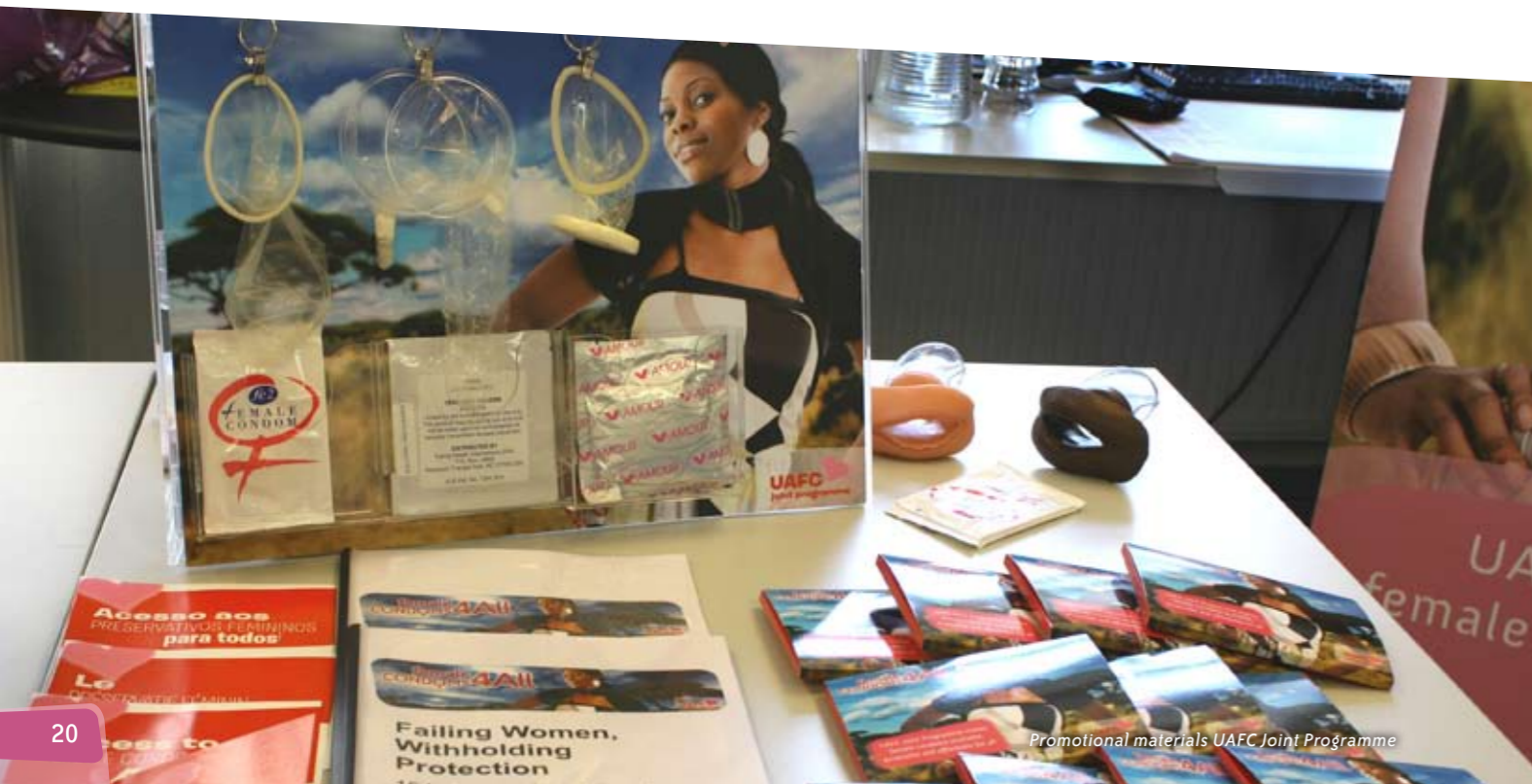
Promotional materials UAFC Joint Programme