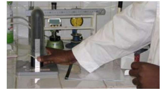
Les préservatifs féminins sont testés dans un laboratoire au Cameroun

L'organisation chef de file doit toujours envoyer de façon systématique les préservatifs féminins nouvellement arrivés à tester par les institutions compétentes chargées du contrôle qualité, afin de s'assurer qu'ils sont conformes aux normes de qualité et ne sont pas des produits contrefaits. Certains pays, en fonction de leur législation pharmaceutique nationale, exigent que des tests de qualité locale du produit soient faits avant de recevoir l'autorisation de distribution et de mise à la vente. Le laboratoire de contrôle de qualité des médicaments fait généralement partie d'une institution gouvernementale. Comme illustration, nous décrivons le cas du Cameroun où le gouvernement exige que les préservatifs féminins soient testés à leur entrée dans le pays. Ainsi, le gouvernement peut contrôler la qualité des produits qui entrent dans le pays et lutter contre l'introduction de produits contrefaits. Le gouvernement du Cameroun est en faveur du préservatif féminin. Dans d'autres pays, le préservatif féminin pré-qualifié par l'OMS peut entrer dans le pays sans contrôle de qualité supplémentaire puisqu'il est conforme aux normes de l'OMS en matière de qualité.