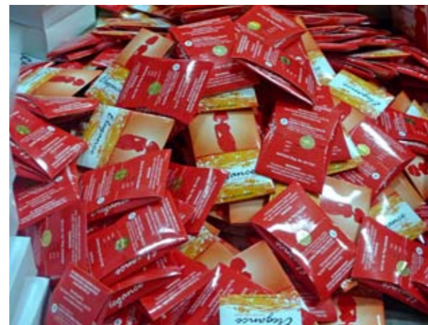
Au Nigeria le préservatif féminin est vendu sous le label "Elegance"

Ce chapitre décrit l'ensemble du système de gestion des achats et des stocks de préservatifs féminins : les achats, l'approvisionnement, le stockage, les mécanismes de distribution. Outre l'approvisionnement et l'administration, la communication au sein de l'équipe en charge de la GAS est importante. Il est essentiel que les différents responsables de la GAS au sein de votre programme communiquent clairement et efficacement les uns avec les autres, afin de s'assurer que les achats, l'expédition et la distribution aux entrepôts, points de vente et pairs éducateurs fonctionnent bien.