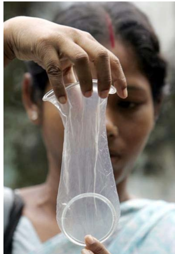
Le préservatif féminin FC2

Imaginez un contraceptif qui offre aux femmes une protection contre les grossesses non désirées, le VIH/SIDA et autres infections sexuellement transmissibles et qui améliore également le plaisir sexuel tant pour la femme que pour son partenaire. Il s'agit du préservatif féminin! Les femmes et les filles subissent les conséquences de rapports sexuels non protégés et supportent l'énorme fardeau des grossesses non désirées et du risque d'infection, notamment par le VIH/SIDA. Le préservatif féminin est le seul contraceptif qui offre une double protection contre la grossesse et les IST, de même que contre le VIH/ SIDA, et il est disponible dès maintenant. Tels sont les arguments de poids en faveur d'une plus grande disponibilité et d'un programme de préservatifs féminins, mais il existe beaucoup d'autres avantages :