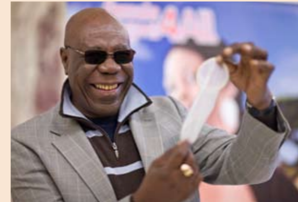
Manu Dibango est un artiste de jazz célèbre au Cameroun. Il est au premier plan dans un clip vidéo qui fait la promotion du préservatif féminin

"Au départ, les gens sont toujours sceptiques. Quand je leur rends visite, ils me demandent ce que j'attends d'eux. Je leur dis que je suis inquiète pour leur personnel ; qu'il faut prendre soin des gens. Quand je leur dis cela, les gens s'ouvrent. Ils me demandent de leur en dire plus et réclament même des préservatifs pour les donner à leurs employés."