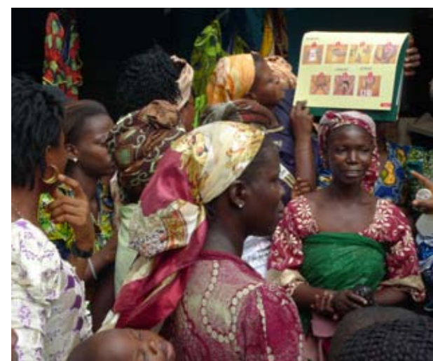
Démonstration de l'utilisation du préservatif féminin sur un marché au Nigéria