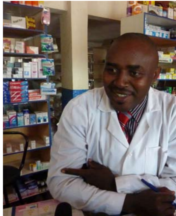
A la Noble Pharmacie à Bamenda : le pharmacien vendant des préservatifs féminins

Les pharmacies, les dépôts pharmaceutiques, les supermarchés, les kiosques en bordure de route, les hôtels et les autres partenaires du secteur privé peuvent être associés dans la vente du préservatif féminin. Ils représentent des endroits que fréquentent les utilisateurs (potentiels). Le personnel de ces points de vente a besoin de formation, de matériel promotionnel et d'un approvisionnement constant en préservatifs féminins. Ces partenaires du secteur privé jouent un rôle important dans la fourniture d'un accès continu au préservatif féminin. Ils sont moins impliqués dans la mobilisation communautaire et la communication interpersonnelle puisque leur premier devoir est de vendre des produits ou des services contre bénéfice. Par conséquent, ils sont principalement au service des utilisateurs réguliers du préservatif féminin qui connaissent déjà le produit et son utilisation.