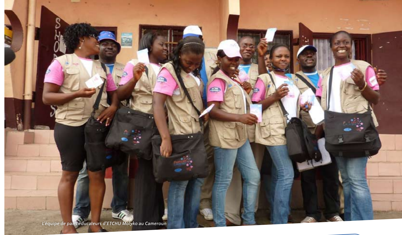
L'équipe de pairs éducateurs d'ETCHU Molyko au Cameroun

...Le Comité directeur du projet UAFC au Cameroun est présidé par le Secrétaire permanent du Comité national de lutte contre le SIDA