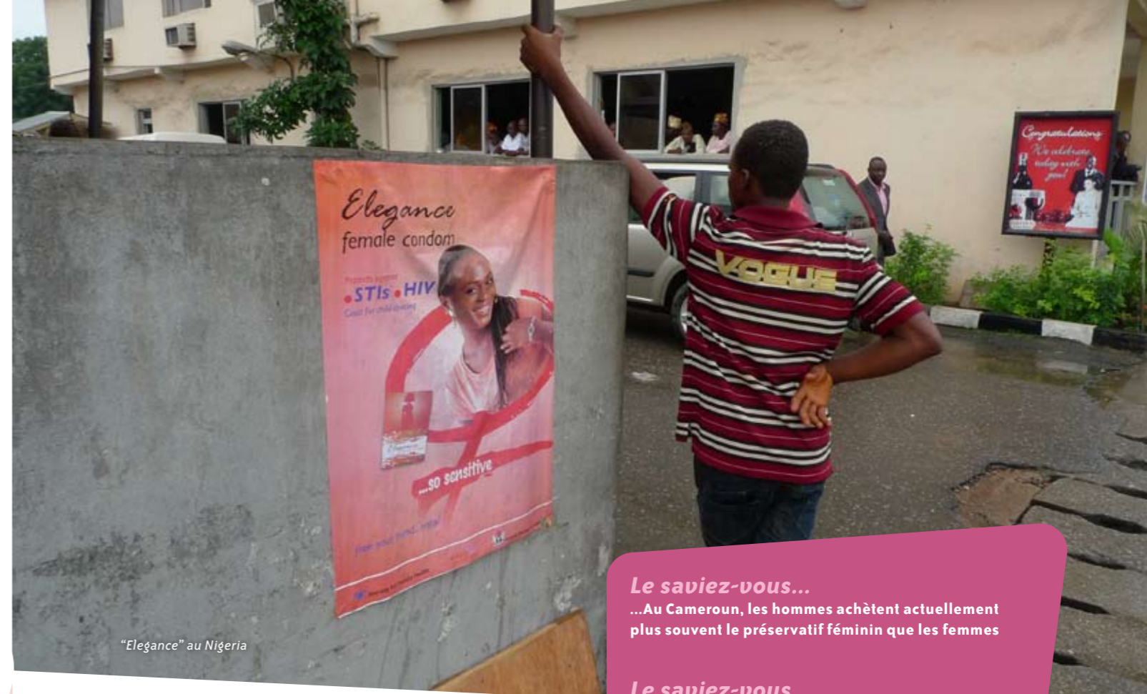
"Elegance" au Nigeria

"Mon mari ne voulait pas que l'on continue à avoir des enfants mais il détestait le préservatif masculin. Alors je tombais tout le temps enceinte. Parfois, nous ne faisons pas l'amour pendant des semaines à cause de ça. Un jour, ma coiffeuse m'a montré le préservatif féminin quand je suis venue me faire coiffer. J'en ai rapporté un à la maison et j'ai essayé de le mettre. Lorsque mon mari est rentré à la maison le soir, je lui en ai parlé mais il n'était pas vraiment intéressé et ne voulait toujours pas faire l'amour avec moi. Je suis revenue voir ma coiffeuse et elle m'a donné des conseils pour négocier avec mon mari afin qu'il accepte le préservatif féminin. J'ai adopté la bonne démarche et réussi à susciter la curiosité de mon mari. Cette nuit-là, il a lui-même inséré le préservatif féminin. Et il a aimé faire l'amour en l'utilisant. Il m'a même dit que j'aurais dû lui dire bien avant que le préservatif féminin était beaucoup mieux que le masculin."