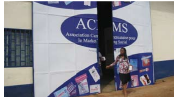
Les préservatifs féminins sont stockés dans ce dépôt de l'ACMS au Cameroun

La planification du stockage de vos préservatifs féminins dans un entrepôt prend du temps et demande une planification minutieuse. Votre entrepôt est une installation vitale de votre chaîne d'approvisionnement et de distribution et il est de la plus haute importance de le considérer de cette façon. Les aspects suivants sont particulièrement importants: