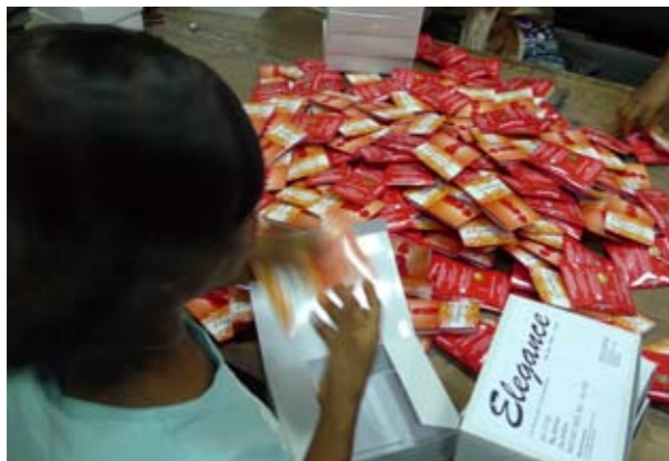
Les préservatifs féminins dans un dépôt au Nigéri.

“Quand j'ai vu les posters chez le coiffeur, j'ai demandé ce qu'était et comment ça marchait. Cela m'a enthousiasmée et j'en ai essayé un. Je tiens ma boutique de cosmétiques au coin de la rue. Je vais aussi vendre des préservatifs féminins. Je viens d'apprendre où je pouvais les commander. Ils seront dans ma boutique le mois prochain. Ils sont tellement bien, tout le monde doit les utiliser.”