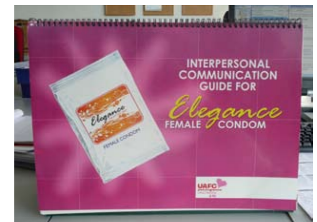
Matériel éducatif de FSH au Nigéria

“Non. Notre vie sexuelle n'était pas terrible parce qu'il n'aimait pas les capotes. Pour cette raison, je n'avais pas tellement envie d'avoir de rapports sexuels parce qu'il voyage beaucoup et je ne suis pas très sûre de ce qu'il fait pendant ses voyages, etc. En fait, une fois la capote s'est déchirée, alors j'ai eu peur et j'ai été traumatisée pendant des mois ! Mais depuis que nous avons commencé à utiliser le préservatif féminin, plus rien de semblable ne s'est produit et je suis de nouveau à l'aise quand nous avons des rapports.”