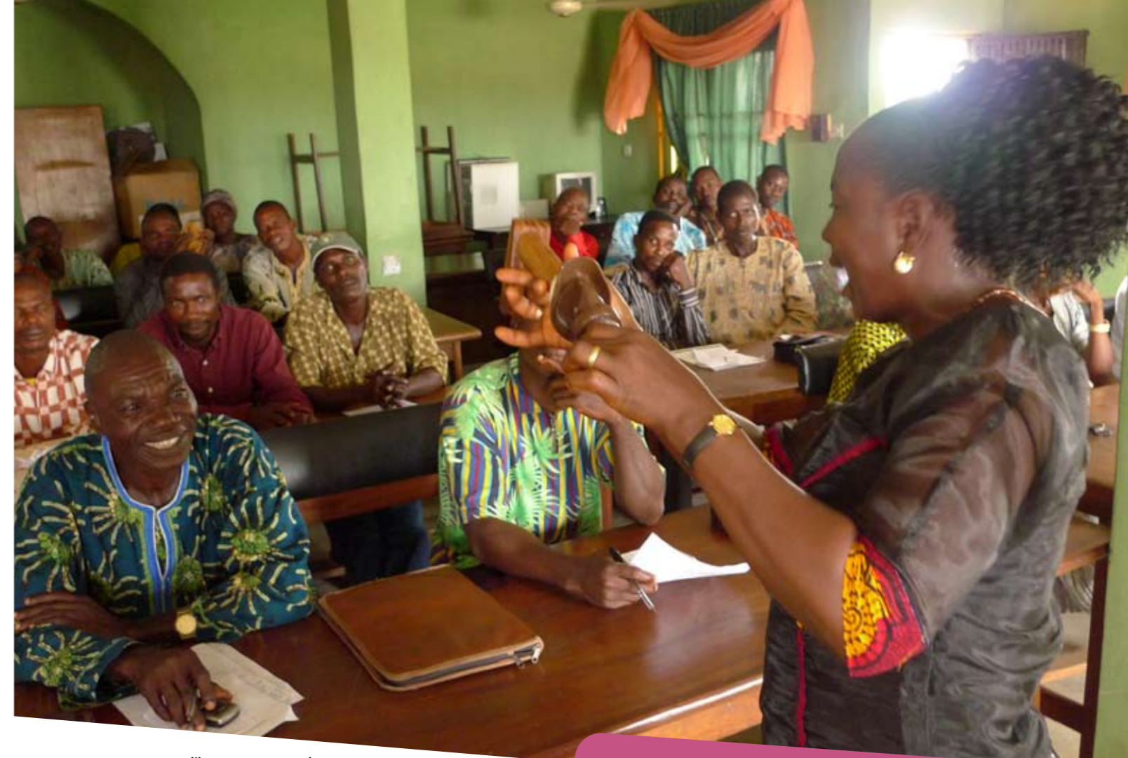
Un groupe d'hommes recevant des informations et des instructions sur la façon d'utiliser un préservatif féminin.

Les radios communautaires constituent un autre canal de communication par lequel on peut toucher les hommes. Lorsque vous concevez une campagne de promotion radiophonique, il faudra inclure les souhaits et les préoccupations des hommes dans les travaux de recherche qui renseigneront la conception de la campagne.