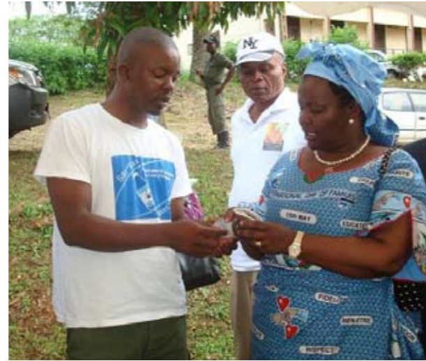
Démonstration de l'utilisation du préservatif féminin devant le Ministère de la Promotion de la Femme et de la Famille

Le préservatif féminin est une méthode de contraception assez nouvelle et souvent mal connue. Par ailleurs, quand les gens connaissent réellement le préservatif féminin, ils tendent à le stigmatiser et à l'entourer de tabous. Ainsi, le soutien des décideurs est-il d'une grande influence dans la promotion et l'approbation du produit par l'ensemble de la communauté. Générer une attitude globalement positive vis-à-vis de l'utilisation du préservatif féminin et de ses avantages nécessite un plaidoyer pour un engagement constant des leaders influents de la société. Ce chapitre décrit comment vous pouvez faire le plaidoyer pour votre cause auprès des différents décideurs, tels que les leaders traditionnels et autres chefs coutumiers, le gouvernement et les institutions publiques afin de pouvoir avoir leur soutien, faire une promotion efficace du préservatif féminin auprès d'eux et, ensuite, obtenir un financement pour la programmation d'interventions axées sur le préservatif féminin. Cela contribuera significativement à votre capacité de créer de la demande et d'élargir l'accès au préservatif féminin