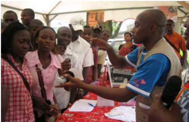
Démonstration de l'utilisation du préservatif féminin

Une participation significative de tous les partenaires (organisation chef de file, partenaires d'exécution et autres parties prenantes) dans la structure de gouvernance les encouragera à soutenir en permanence et à pérenniser votre programme de préservatifs féminins. La planification de programmes participatifs, les possibilités de formation continue, la participation aux réunions d'évaluation, à des cours de recyclage réguliers et une restitution sur le rendement du personnel sont tous autant de moyens pour motiver les organisations à base communautaire et les pairs éducateurs à rester engagés vis-à-vis de votre programme. Tous les partenaires de la structure de gouvernance doivent avoir un accès facile à des informations de suivi transparentes et à jour afin de pouvoir participer utilement au programme.