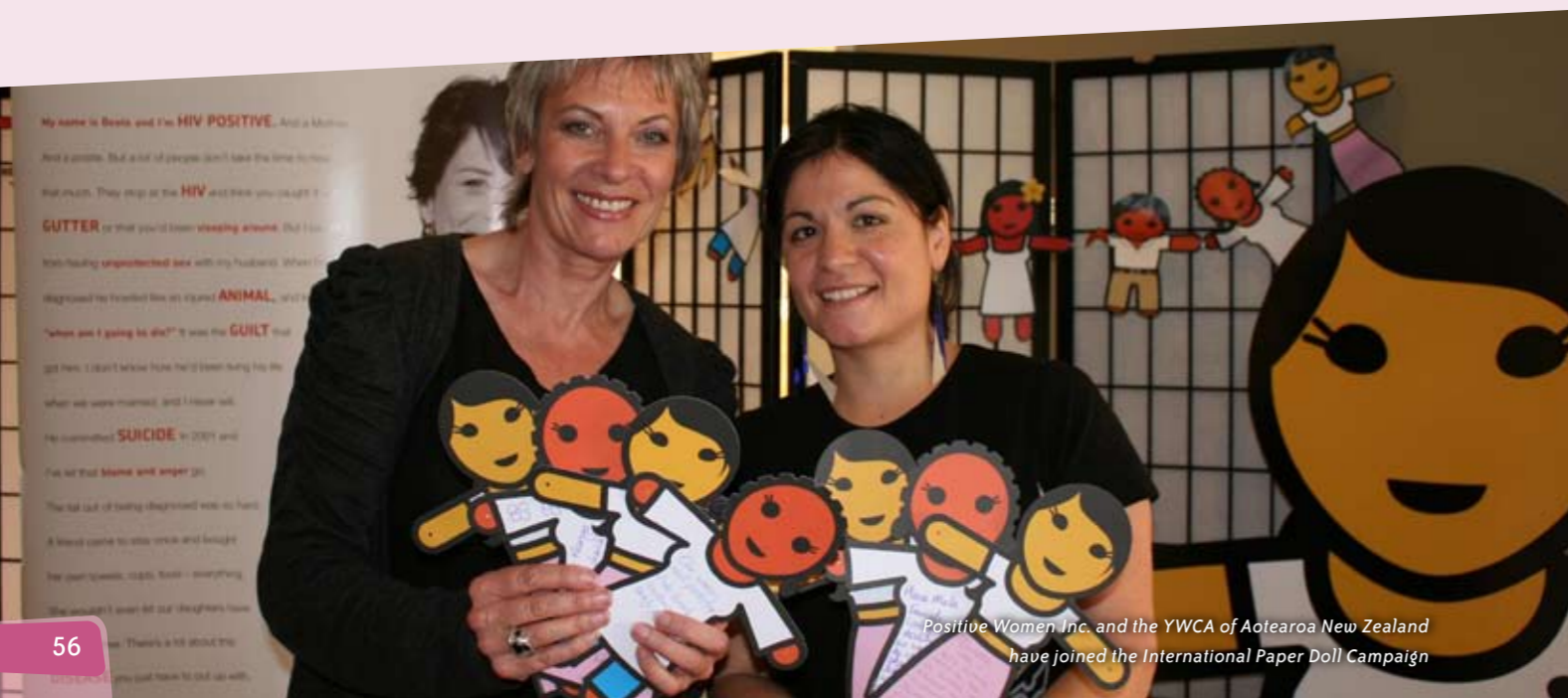
Positive Women Inc. and the YWCA of Aotearoa New Zealand have joined the International Paper Doll Campaign