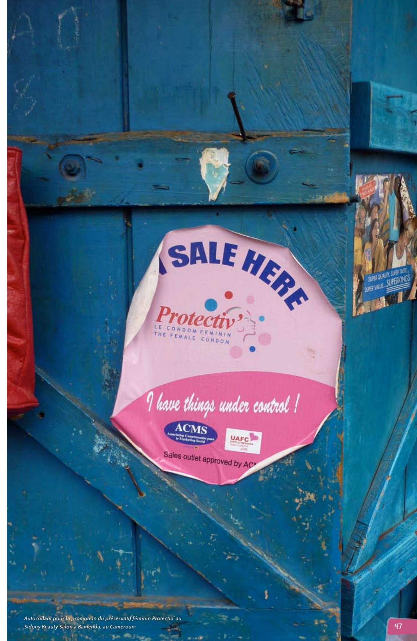
Autocollant pour la promotion du préservatif féminin Protectiv' au Sidony Beauty Salon à Bamenda, au Cameroun