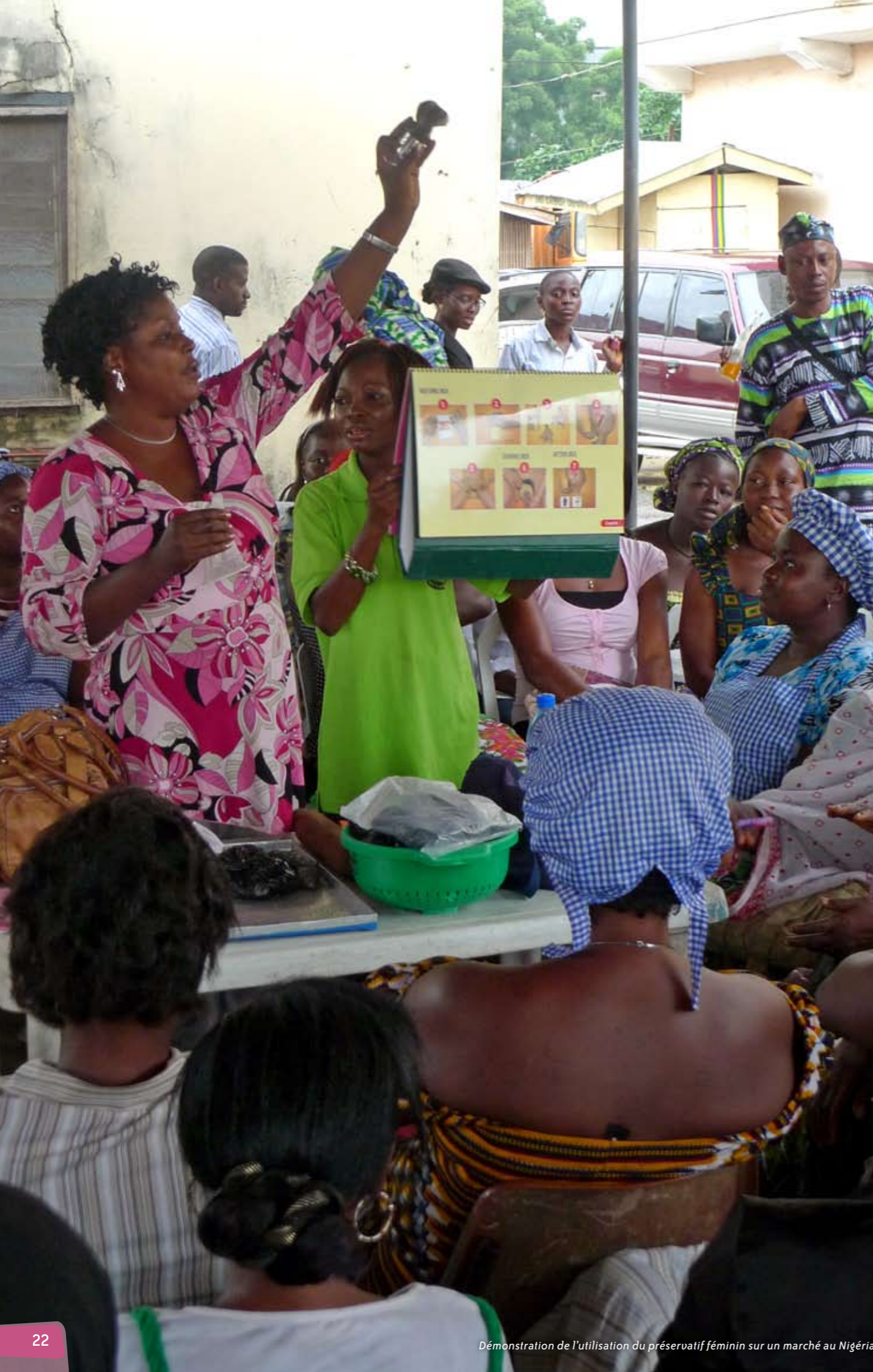
Démonstration de l'utilisation du préservatif féminin sur un marché au Nigéria