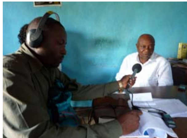
La station "Hot Cocoa" de Bamenda au Cameroun est un canal important de communication

Les médias peuvent être un outil puissant pour sensibiliser les gens sur le préservatif féminin, mais leurs effets peuvent tout à la fois être désastreux si les messages diffusés sont inexacts et stigmatisants. Travailler avec les médias exige donc une planification et un contrôle minutieux. Avant de commencer il n'est pas superflu de comprendre quelles lois régissent les médias et la publicité dans votre pays. Dans certains pays, il y a des lois qui interdisent la publicité autour des produits médicaux. Si c'est le cas dans votre pays, vous devez chercher à savoir si le préservatif féminin est considéré comme un produit médical avant la conception et la planification de votre stratégie de marketing. Le cas échéant, il est conseillé d'impliquer le Ministère de la Santé pour contourner cette interdiction.