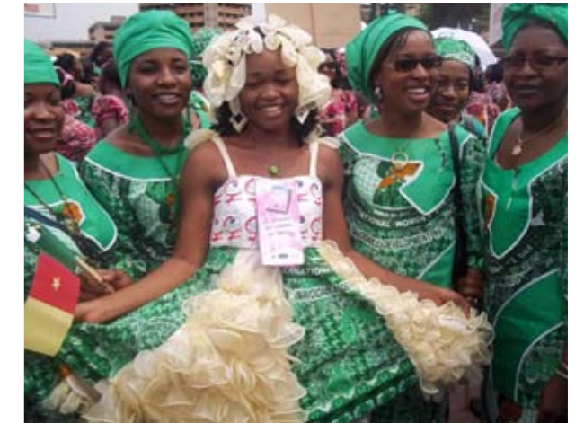
La mascotte de la campagne de sensibilisation relative au préservatif féminin au Cameroun. Jeune femme portant une robe faite de préservatifs féminins.

Une autre façon d'impliquer les personnes influentes consiste à leur faire prendre part au lancement officiel de votre programme de préservatifs féminins. Les responsables des ministères, les parlementaires ou les membres des organes techniques nationaux ou de mise en œuvre pourraient également être invités à devenir membres du comité directeur ou du conseil consultatif de votre programme. 53